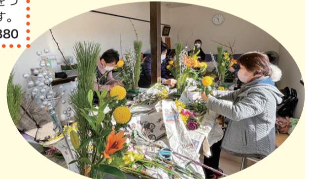
フラワーアレンジメント つだか支部