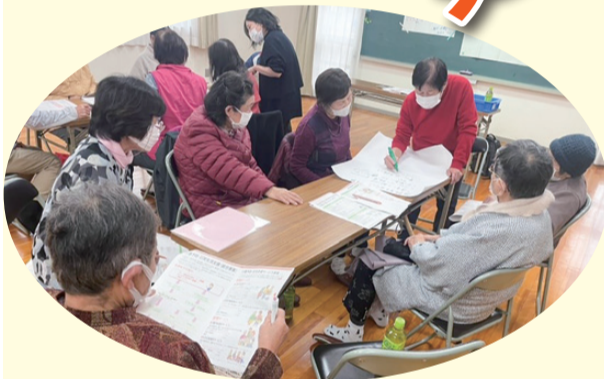
「介護保険制度」学習会 雄神支部