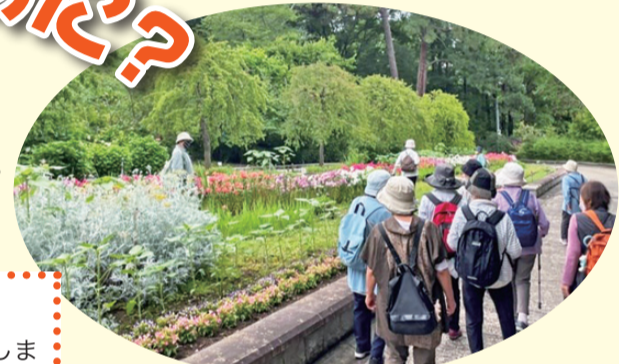
ウォーキング 芥子山支部