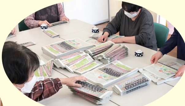
「健康と生活」仕分け 三助支部