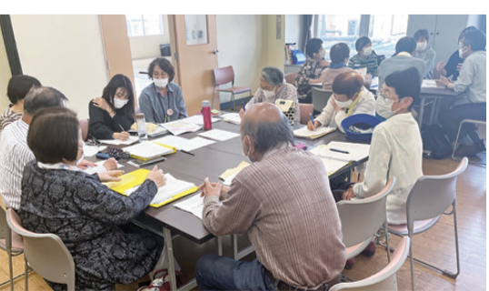
活発に意見を出し合うメンバー

北区エリアではコープ大野辻クリニック跡地を利用し、北区エリア新規事業プロジェクトとして毎月話し合いを行っています。 話し合いの中で、岡山医療生協の健康づくりや組合員活動を発信できる場であってほしい。運動もできて支部間交流もできる場として利用したいと要望があり、「健康づくり」「組合員活動」「運動・リハビリ」の3つのキーワードを軸に事業を展開していくことが決まりました。