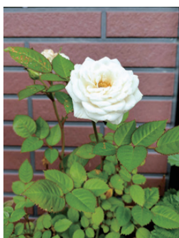
岡山市東区 やつくん

母の13回忌でした。総勢13名が集いお寺で拜んでもういました。焼香していると、写真の母が少しだけ微笑んでいるように見えました。「お母さん有難う！ これからもよろしくね。私、頑張るから！」外に出てみると、ハナミズキがきれいに咲いています