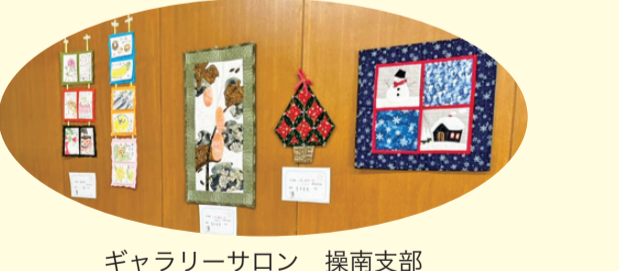
ギャラリーサロン 操南支部