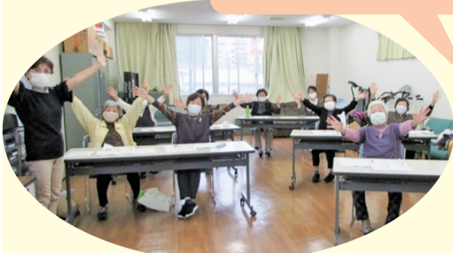
脳いきいき教室 財田支部