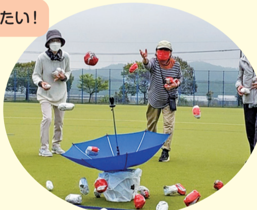
運動会 中区東エリア(7つの支部合同)