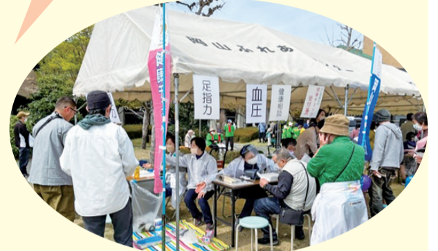
健康チェック 操明支部