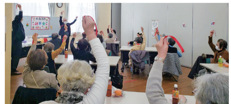
【その他】牛窓支部は市街地からは遠隔なため、支部としての活動はしているが、もつと中央からの影響、思惑があらばと思う。